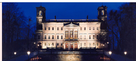
Festliche Ballnacht in Ballkleidung vorzugsweise des 19. Jahrhunderts – Anfang 20. Jahrhundert im Kronensaal Schloss „Albrechtsberg“ Bautzner Straße 130 | 01099 Dresden