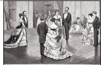
THE POSITION IN QUADRILLE

Der Nachmittag für individuelle Freizeit